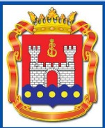
СХЕМА ТЕРРИТОРИАЛЬНОГО ПЛАНИРОВАНИЯ КАЛИНИНГРАДСКОЙ ОБЛАСТИ